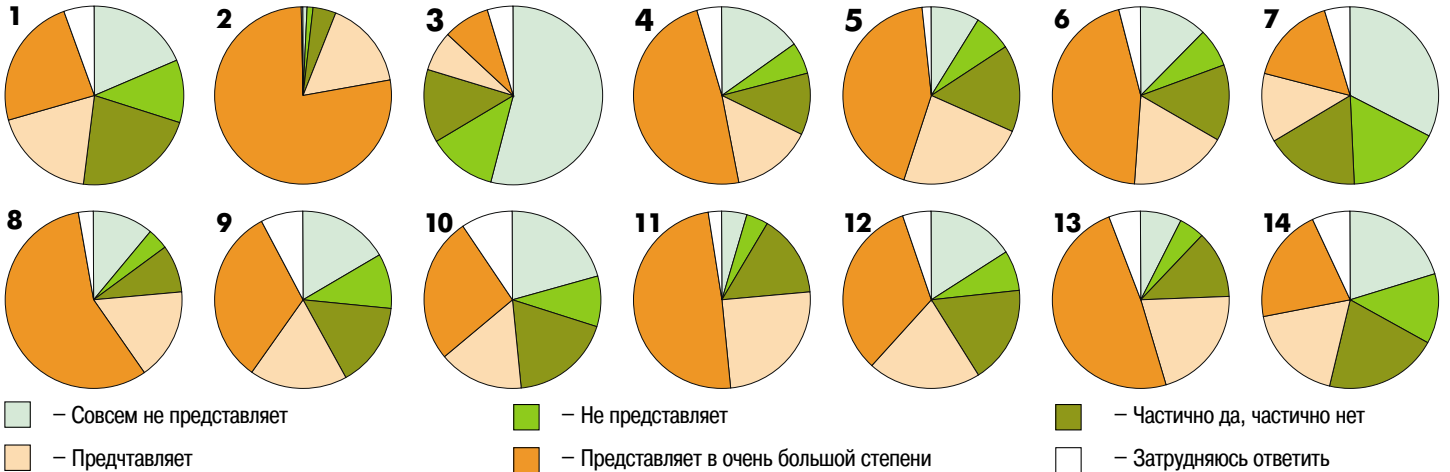
По данным исследования "Современное российское общество, переходный период", проведенного центром "Социоэкспресс" Института социологии РАН с 01.11.1998 по 31.12.1998

Именно иерархия проблем, осознаваемых массовым сознанием как острые, определяет ожидания в отношении политики правительства - его первоочередной задачей видят круг вопросов, связанных с решением материальных проблем.